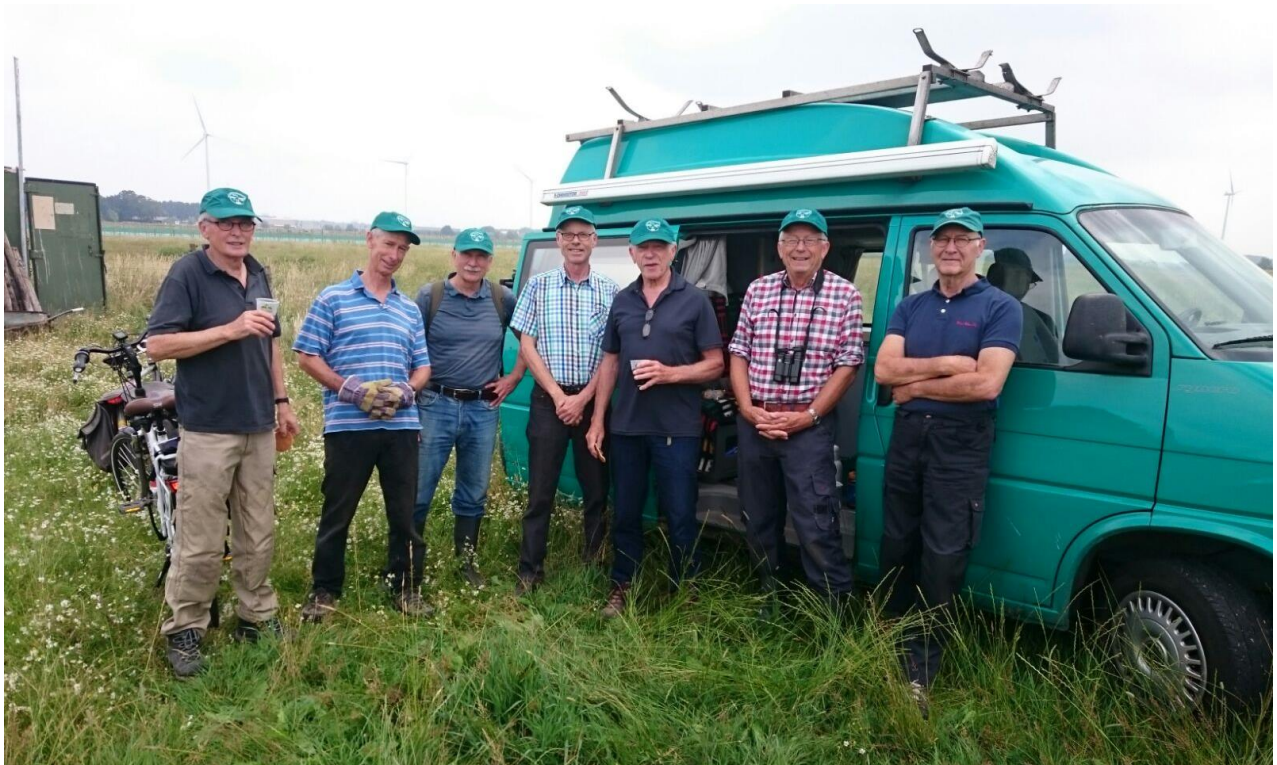
de vaste kern vrijwilligers die het beheer uitvoeren op De Kroon

Het perceel direct ten oosten van De Kroon ('het land van Albert') is aangekocht door Vitens. Er zijn en worden gesprekken gevoerd met vertegenwoordigers van Vitens om te komen tot een meer weidevogelvriendelijk beheer van dit perceel. Met de huidige zeer intensieve bedrijfsvoering is het niet mogelijk dat er weidevogels kunnen broeden.